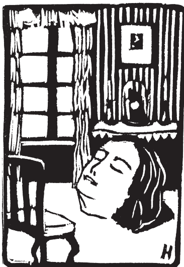
«פנים», תחריט מאת צבי גולן בירחון «שבתאי», מרץ 1912

גולן על מוצאו. הוא אמר כי תמיד הרגיש שאשה זו אינה אמו, לא סלח למשפחתו על שעזבה אותו ולא חידש את הקשר עימם 4 .